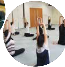
【子育てママリフレッシュ講座】