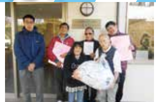
ワークハウスふたば