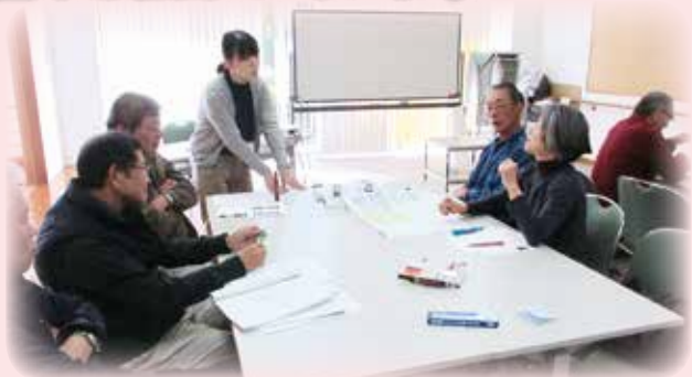
2層協議体での話し合い（敷島北地区ささえ愛隊）