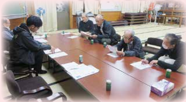
地域での話し合い（上篠原地区）