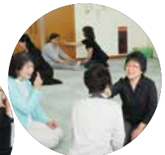
【ボランティア養成講座】