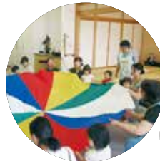
【子育てサロン事業】

社協では子育て支援事業として、子育て中の親子の居場所づくり・交流の場として「子育てサロン」を月1回、お母さんのための「リフレッシュ交流会」を年3回、また、子育て支援に興味のある方や応援したい方を対象とした「ボランティア養成講座」を年3回開催しています。令和2年度も多くの皆様のご参加をお待ちしております。詳しくは毎月の甲斐市広報、社協だよりへ随時掲載します。