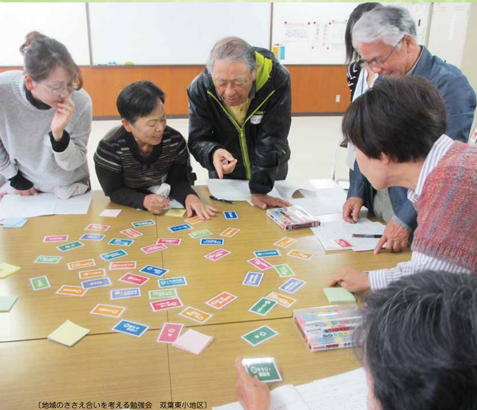
〔地域のささえ合いを考える勉強会 双葉東小地区〕