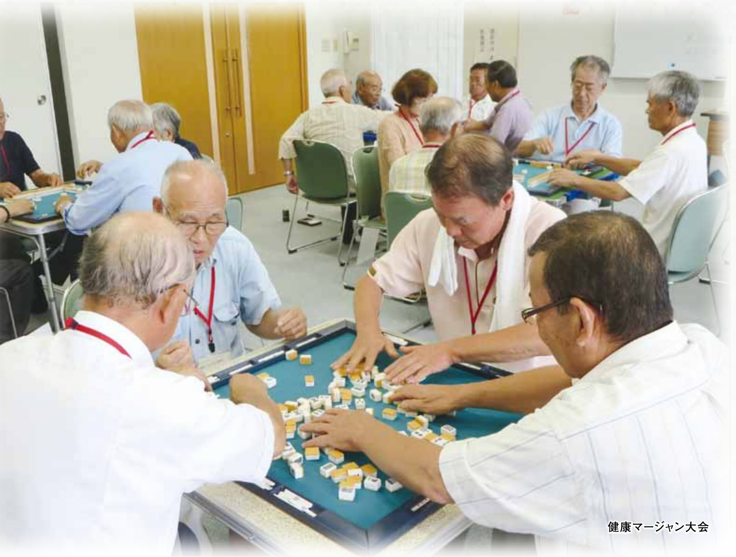
健康マージャン大会