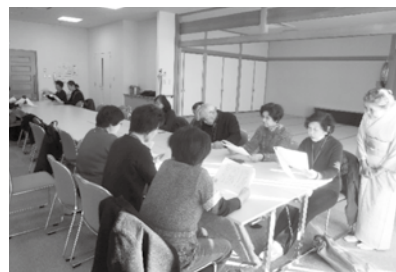
平成26年度朗読講習会