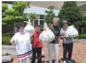
ワークハウスふたば