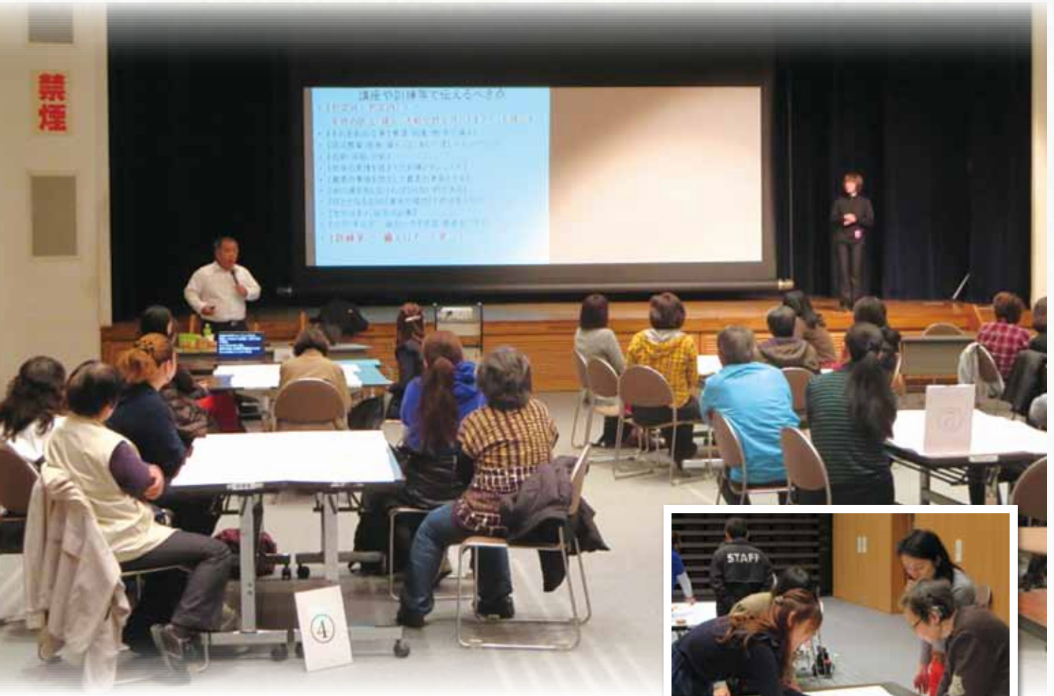
災害時要配慮者のための災害講習会