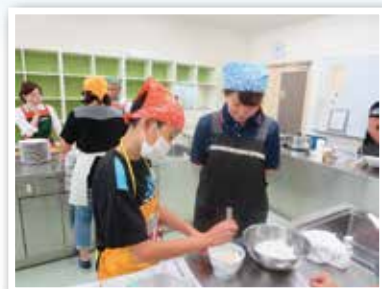
障がい児学童支援事業