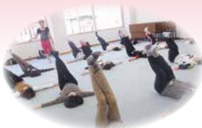
リフレッシュエクササイズ

講座のお知らせは、甲斐市広報「甲斐」、社協だより「かがやき」にて随時掲載予定です。