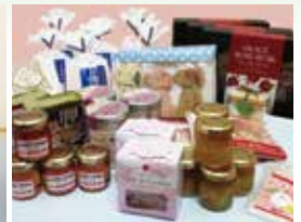
株式会社ろすまりん