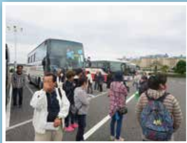
1日バス外出事業「レクリエーション」