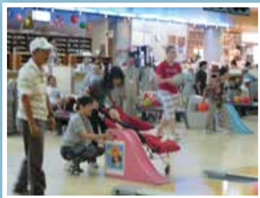
ふれあい福祉ボウリング大会

障がい児への支援事業としては、夏休みの期間中に児童を預かり、室内活動やバス外出を行う「障がい児学童支援事業」や療育支援を目的とした「リトミック教室」、季節行事である「ふれあい福祉クリスマス会」を実施いたしました。