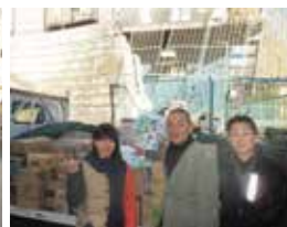
株式会社雨宮商会