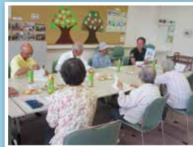
障がいサロン「みーんなおいでよ」