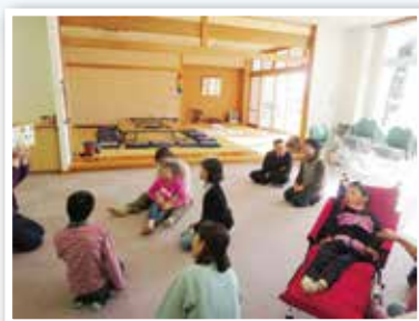
療育支援「リトミック」