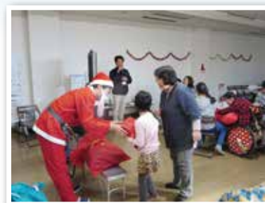
ふれあい福祉クリスマス会

☆平成29年度も障がい児者のための事業を実施いたします。 参加者募集については実施時期に合わせて市広報誌への掲載や、募集チラシを市内各保健福祉センター、市役所に設置いたします。