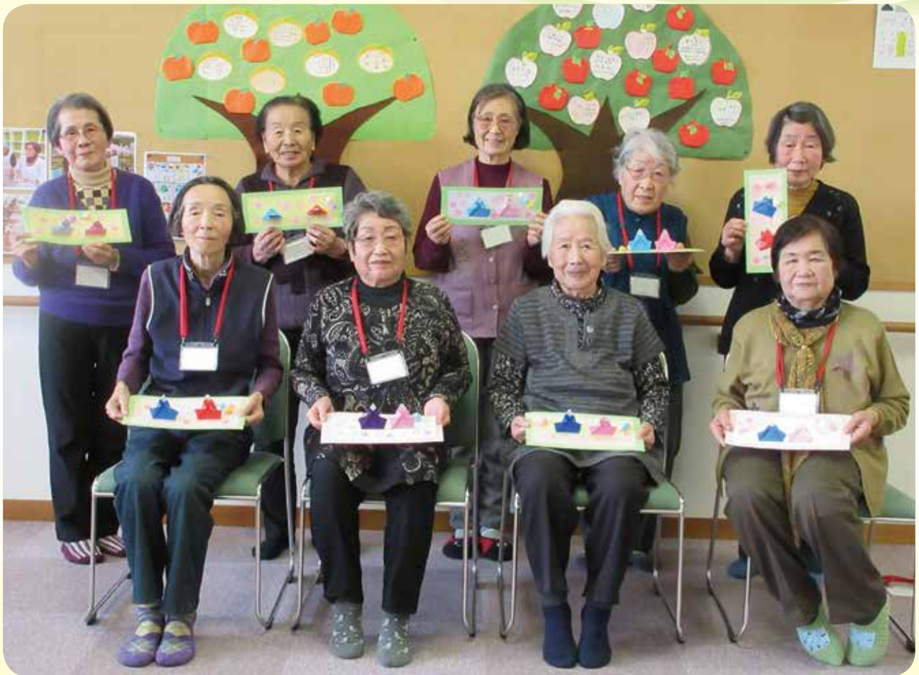
ミニデイ「社協」 ひなまつり