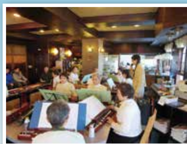
食と音楽を楽しむ会