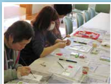
教養講座「絵手紙教室」