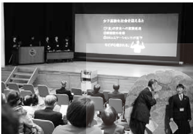
農林高等学校 農業クラブ

初めに農林高等学校農業クラブによる「伝統野菜でつなげる地域交流活動」の発表をしていただき、次に敷島小学校合唱部の合唱を会場の皆さんと一緒に楽しみました。