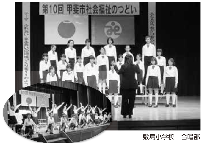
敷島小学校 合唱部