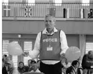
地域のイベントに協力(高齢者運動会)