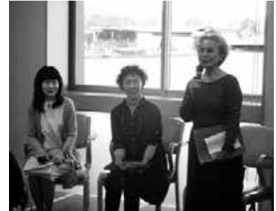
特技を活かした施設訪問(朗読)