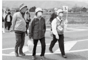
4月(春) 10月(秋) 歩け歩け大会