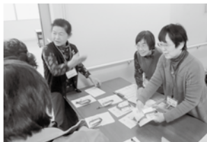
ふれあい会食会(通年)