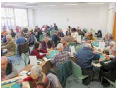
健康マージャン大会