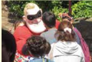
一日バス外出レクリエーション