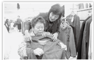
利用者の買い物支援活動