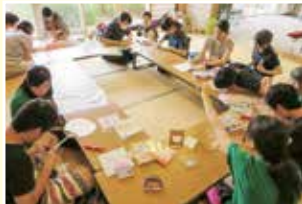
障がい児学童支援