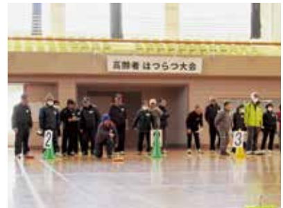
高齢者はつらつ大会(カローリング)