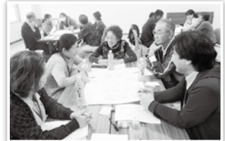
年2回の交流会の様子

甲斐市ボランティアセンターまでご連絡ください。申請紙を記入し、毎月開催されている事前研修を受ければすぐに活動可能です。