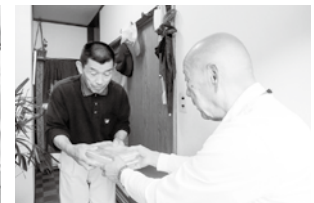
配食サービス配達ボランティア(通年)