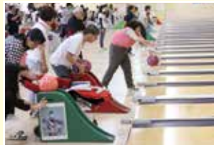
ふれあい福祉ボウリング大会