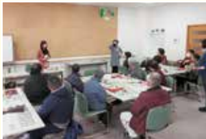
障がいサロン「みんなおいでよ」