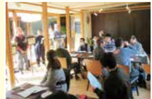
食と音楽を楽しむ会