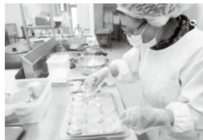
配食サービス調理ボランティア(通年)