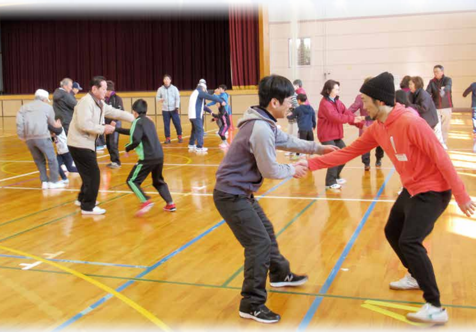
三世交代事業「スポーツ鬼ごっこ」