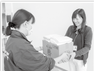
タオル引渡しの様子

リサイクル意識の啓発を図ることを目的に、未使用タオルの募集を行い、今年度も約750枚のタオルが集まりました。ご協力ありがとうございました。