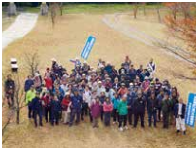
高齢者歩け歩け大会