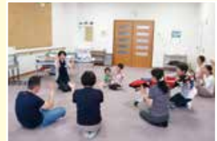
療育支援「リトミック」