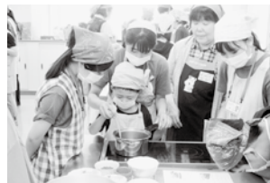
障がい児者イベント(通年)