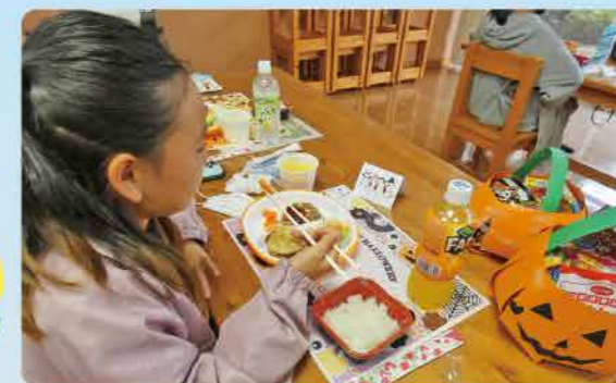
～子ども食堂食事の様子～