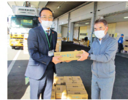
株式会社はくばく 様