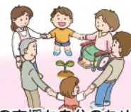
誰かのための支援も自分のための支援になる 支える人も地域で活躍できる機会になる

高齢者をはじめとする地域の方の困りごとを、地域住民の方や多様な主体によりささえ合う活動です。又、活動を通して地域のつながりづくりにもなる地域の福祉力を高めていく活動です。