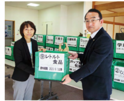
パルシステム山梨 様