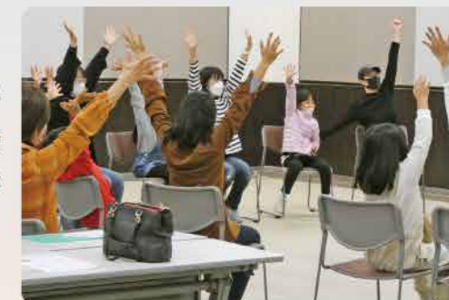
～昭和町社協共催子ども食堂の様子～

11月には近隣市町との広域的な活動として昭和町社協と共催で子ども食堂を開催しました。イオンモール甲府昭和にて開催し、音楽に合わせて体を動かしたり、工作に夢中になったりと、参加した保護者や子ども同士の交流が図れました。