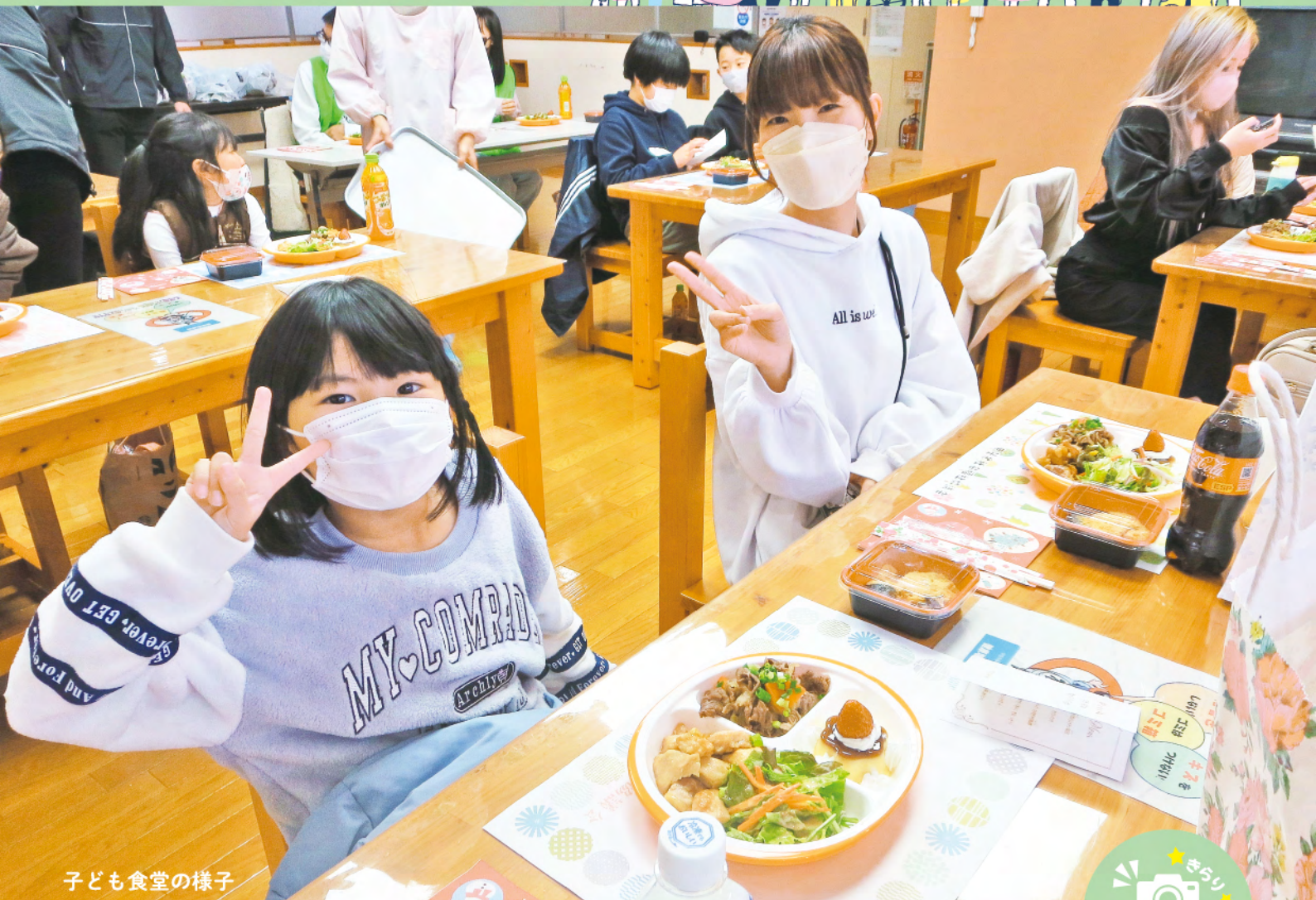
子ども食堂の様子