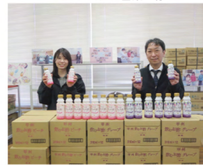
株式会社テンヨ武田 様