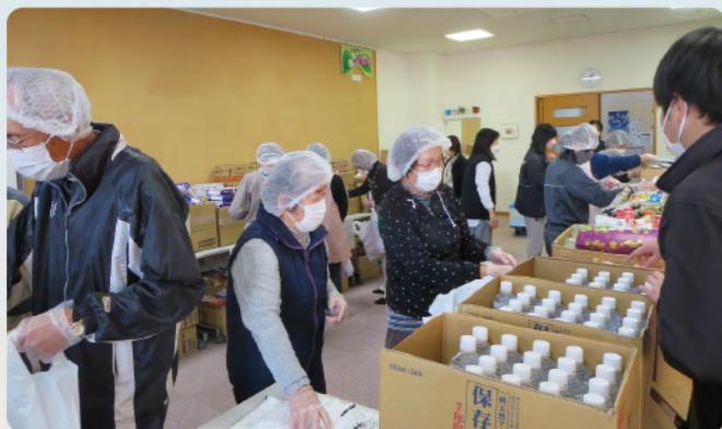
～食料袋詰めの様子～

子ども食料支援事業は、多くのボランティアの協力により食料やお米の仕分け作業、食料寄付箱等からの回収が行われています。