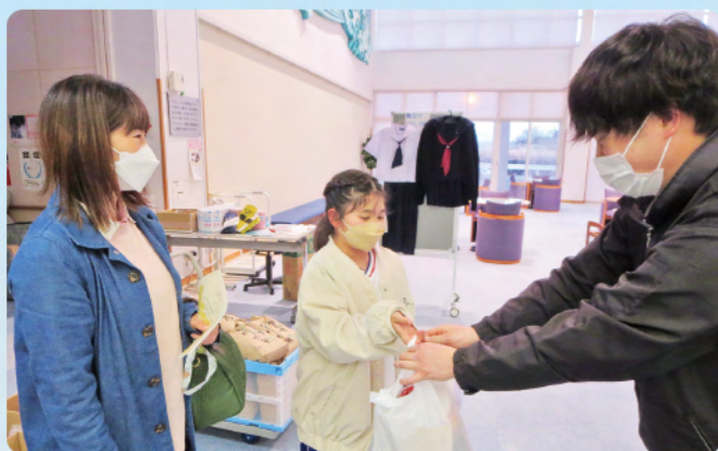
～春休み子ども食料支援の様子～