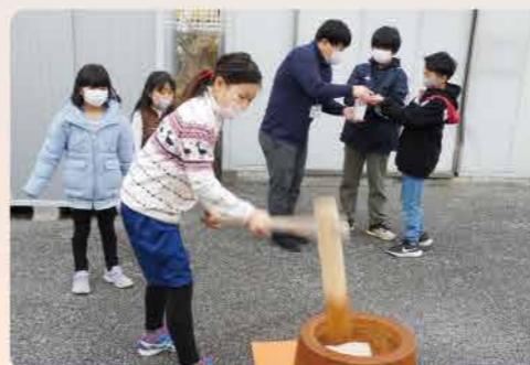
～子ども食堂餅つきの様子～

12月には家庭ではなかなか体験ができない餅つきの体験や科学実験を取り入れたクリスマスツリー作りを行いました。餅つきに参加した児童からは「餅つき楽しかった。初めて体験したけど上手つけて良かった」など嬉しい声がありました。