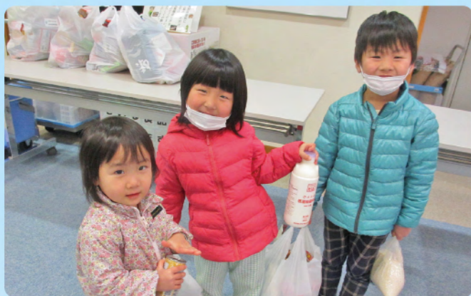
～冬休み子ども食料支援の様子～