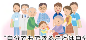
“自分でもできることは自分 でする”健康維持には大切

困った時に誰かの力をちょっとだけ借りれば解決できるものもあります。以前は自分で出来ていたけれど、年齢を重ねることで苦手になった部分を、身近な人達で出来ることを少しずつお手伝いするささえ合いが必要なのです。