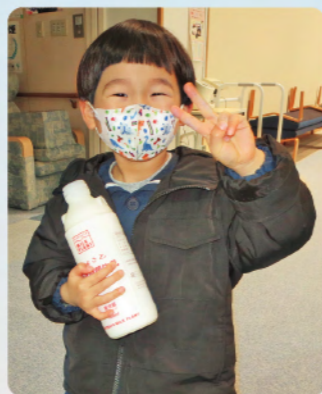
～県産牛乳支援の様子～