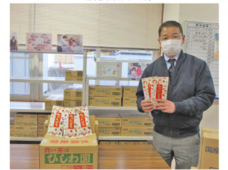
株式会社菱和園 様