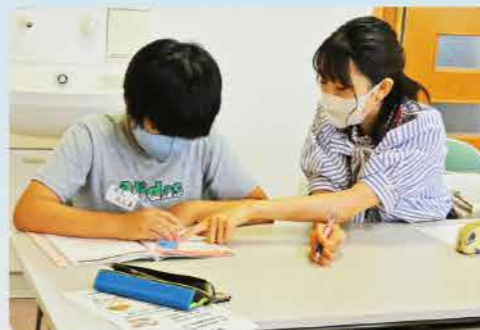
～子ども学習支援事業の様子～

子ども学習支援事業は、令和4年度に新たに実施した取り組みです。夏休みの宿題や学校の授業でわからない点などを大学生ボランティアが教える学習支援がメインの子ども食堂で、学習支援の後に食事を楽しむ内容です。参加した児童生徒からは「やさしく教えてくれてわかりやすかった」という声もあり、勉強に集中できていた様子でした。