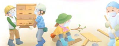
ささえる側、ささえられる側の関りではなく 困った時はお互いさまの関係がとても大切 自分のできる事で支え、ある時は支えられ、 お互いさまのささえ合い

ごみ捨てや草取り等の生活支援や安否確認や孤独・孤立を防止する声掛けや日々の見守り、免許返納や公共機関が利用できない理由等で買い物や受診などの外出の移動支援、近くの場所に人とふれあう通いの場づくり等の活動があります。