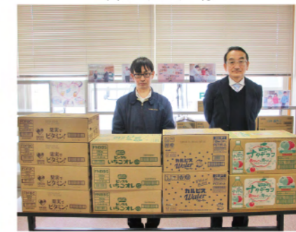
株式会社フローレン 様