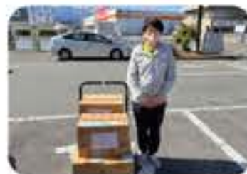
カーブスオギノ貢川