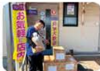
カーブス甲斐竜王

CornerPocket (ハケ岳の手作りパン屋)、 双葉農の駅、生活協同組合ユニー若草センター、 とみや、(株)八雲製菓、(株)はくばく、(株)テンヨ武田 (株)セブンイレブン・ジャパン、神州一味噌(株)