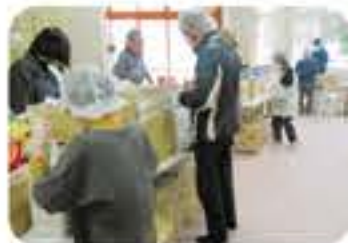
ボランティアによる袋詰めの様子