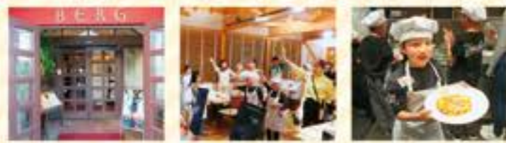
さあ! 開店です! じゃんけん大会で大盛り上がり! ピザが焼けたよ!