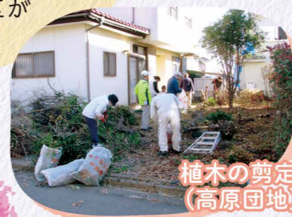
植木の剪定(高原団地)