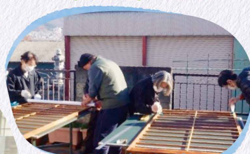
障子張替え(敷島台)