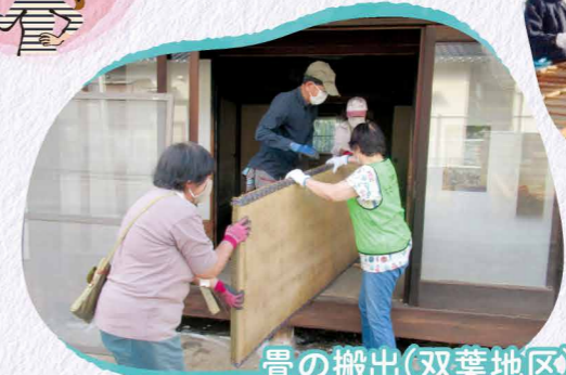
畳の搬出(双葉地区)