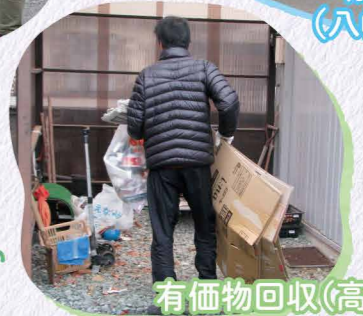
有価物回収(高原団地)