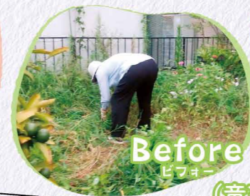
Before → After ビフォー アフター