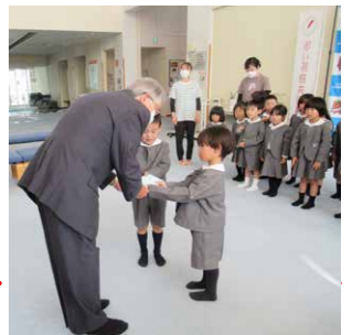
富士幼稚園の皆様