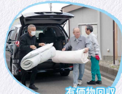
有価物回収(八幡新田2区)