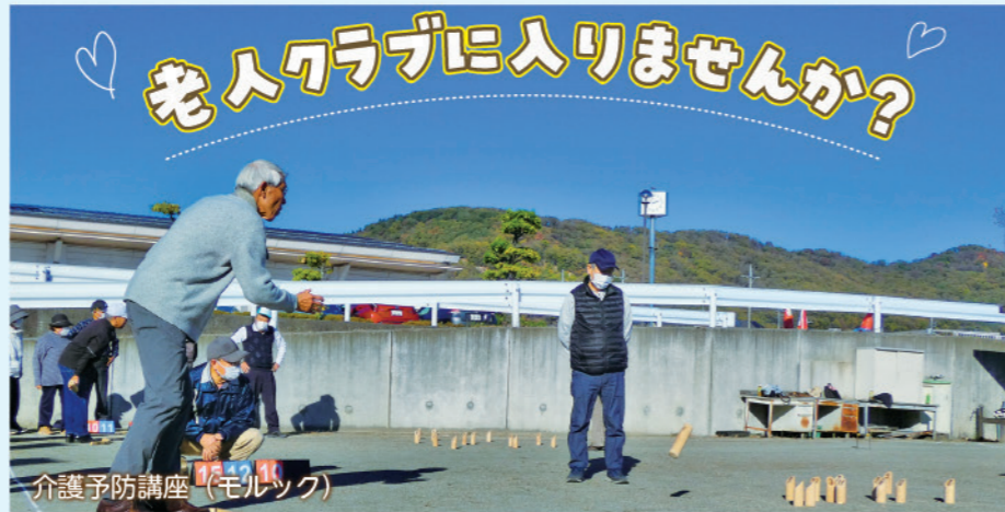
介護予防講座（モルック）

えっ！老人？失礼な！と思わないでください。「老人クラブ」とは昭和38年に施行された「老人福祉法」という法律において老人福祉を増進するための組織として位置づけられています。いつからか「老人」という単語にネガティブなイメージがついてしまいましたが、実際の活動内容はとってもアクティブで、みなさん生き生きと自分らしく活動されています。