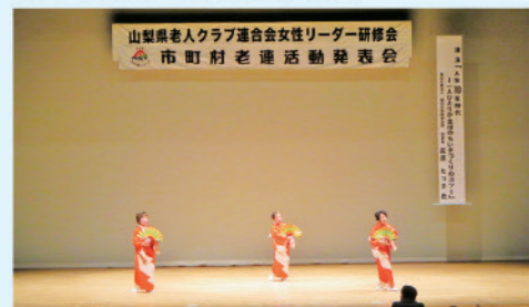
県老連主催の活動発表会にも参加しました