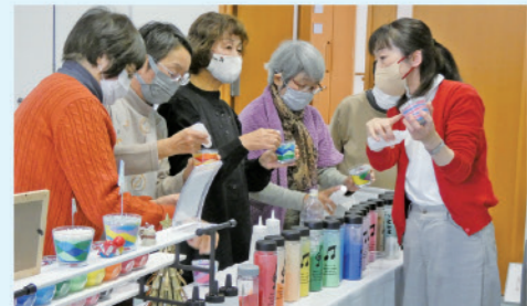
女性リーダー研修ではカラーサンドアートを製作しました