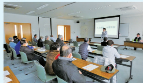
教養講座として「学校では教えてくれないお金の授業」を開催しました