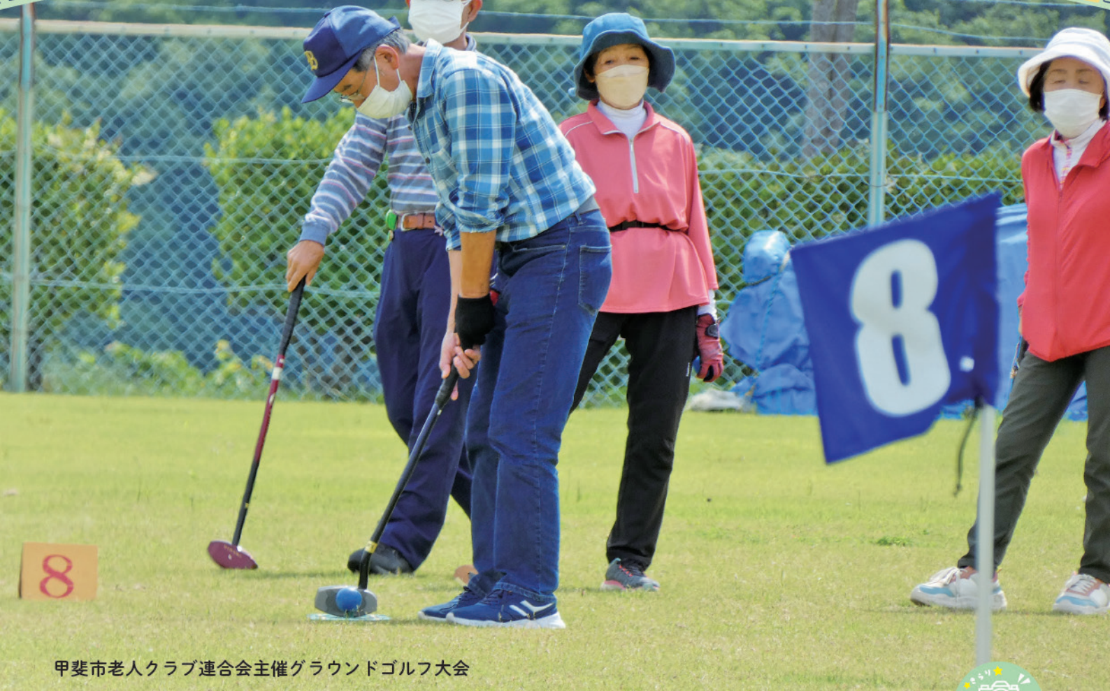
甲斐市老人クラブ連合会主催グラウンドゴルフ大会